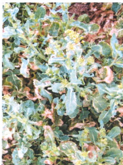
Obr. 4 – Zasychání mrazem poškozených listů řepky a některých vrcholových pupenů

Významným činitelem, který vše může ovlivnit, je další vývoj počasí a zejména rozložení srážek. Přejde-li v tomto období nedostatek srážek a sucho je regenerační schopnost takovýchto porostů značně oslabená a poškození rostlin se může prohloubit. Výživářská a další agrotechnická opatření by se měla podle toho selektivně uplatňovat a měl by tomu předcházet podrobný rozbor rostlin (např. Laboratoř biologie stresu zemědělských plodin ve VÚRV-Ruzyni provádí mikroskopické analýzy poškozených vrcholů ozimů).