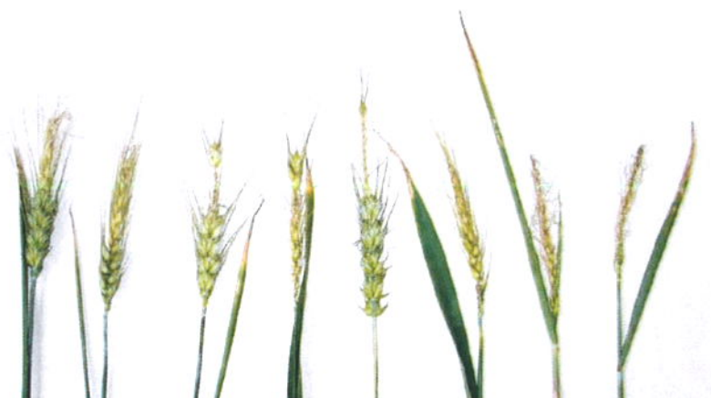
Obr. 5. – Poškozené klasy pšenice mrazem v době metání

V článku uvedená mrazová poškození ozimů v jarním období souvisí s pokročilým růstem a vývojem rostlin ozimů, často urychleným průběhem teplých zim. Předčasné výsevy obilnin mohou tento trend ve vývoji ještě více prohloubit, a proto by se pro ně měly vybírat především odrůdy, které jsou méně citlivé na délku dne a jsou pozdní.