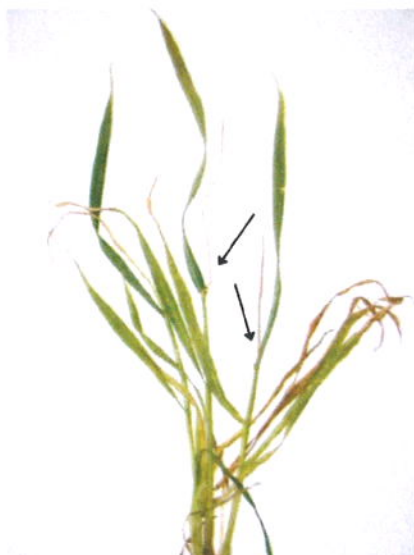
Obr. 3 – Zasychání vrcholů u pokročilých odnoží v důsledku jejich vymrznutí

a biotické faktory, jako jsou například sucho, další mrazy, virózy, houby či škůdci. Na druhé straně je třeba uvést, že rostliny ozimů mají v tuto dobu ještě velkou schopnost regenerace a existuje i řada kompenzačních možností, které mohou výrazně zmírnit negativní dopady na výnos ozimů. Z biologických vlastností je to např. dodatečná tvorba odnoží u obilnin či urychlení vývoje květenství na postranních větvích u řepky.