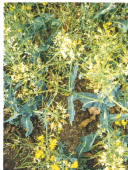
Obr. 6 – Poškozené květenství a vývoj šešulí u řepky květnovými mrazy