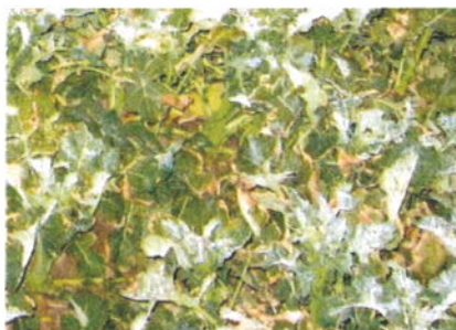
Obr. 1 a 2 – Mrazové poškození pšenice a řepky ranními mrazy na počátku jarní vegetace

Např. průměrná teplota v zimě 2019–2020 byla v ČR 2,0 °C, což je o 3,3 °C více ve srovnání s normálem 1981–2010. I letošní zima byla teplotně nadnormální (prosinec 2021 o 1,4 °C, leden 2020 o 2,0 °C a únor 2022 zhruba o 3 °C nad normálem). Přitom počet mrazivých dní je během zimy minimální, má klesající tendenci a ozimy v takových zimách přezimují bez většího poškození mrazem. Rostliny však během teplých zim stále pokračují v růstu a po ukončení jarovizace (obvykle do konce prosince) u nich probíhá postupná diferenciací květních orgánů. Přechod z vegetativní do reprodukční fáze u nich nastává již ke konci zimy a na počátku jarního období. I letos již můžeme na počátku března pozorovat porosty pšenice ve vývojové fázi dvojitých hrbolků na vzrostném vrcholu, tj. na počátku diferenciací klásků. Tento přechod může být ještě více urychlen u velmi raných výsevů, a je i odrůdově rozdílný. Takové rostliny pak vstupují do růstových fází, kdy výrazně klesá jejich odolnost k mrazu, a navíc jejich rychle se vyvíjející reprodukční orgány mohou již být poškozeny běžně se vyskytujícími mrazy v jarním období.